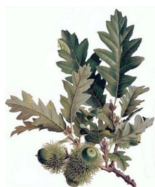
Quercus cerris L.

Le piante utilizzate dai carbonai per fare il carbone erano prevalentemente le querce. Per la maggior parte cerro ( Quercus cerris L.) e roverella ( Quercus pubescens Will.). In parte ridotta, per la loro minore presenza, i carpini ( Ostrya carpinifolia Scop. e Carpinus betulus L.), gli aceri ( Acer monspessolanum L. e Acer campestre L.) e i frassini ( Fraxinus ornus L. ed Fraxinus excelsior L.). Di fatto le essenze arboree più diffuse nei “querzeti misti” dei nostri territori.