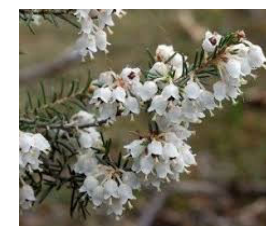
Erica arborea L.