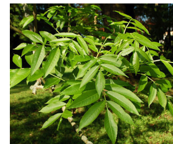
Fraxinus excelsior L.

Un tipo di carbone chiamato dai carbonai cannellino , con un alto valore calorico e una pezzatura più piccola che evitava di doverlo spezzare quando si cucinava era quello ottenuto dalla cosiddetta "macchia mediterranea" costituita da corbezzolo ( Arbutus unedo L. ), erica ( Erica arborea L. ), ginepro ( Juniperus oxycedrus L. ), lentisco ( Pistacia lentiscus L. ), fillirea ( Phillyrea latifolia L. ). Arbusti con accrescimenti lenti e piccole sezioni nelle parti legnose.