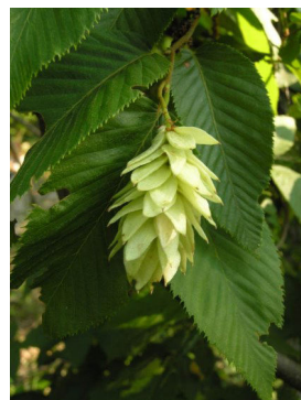
Carpinus betulus L.