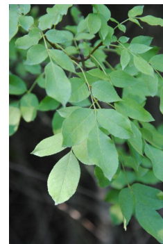
Fraxinus ornus L.