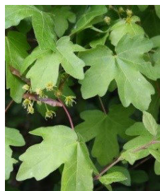
Acer campestre L.