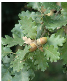
Quercus pubescens W.