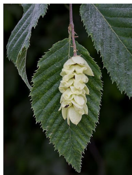
Ostrya carpinifolia S.