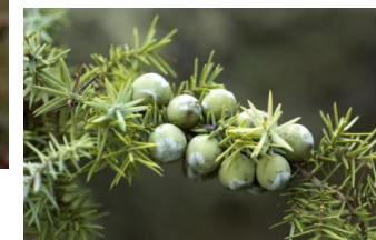
Juniperus oxycedrus L.